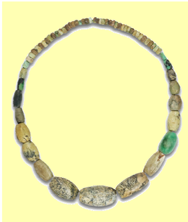
Collaret de variscita