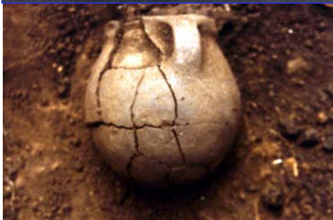
Ceràmiques del Cardial clàssic. Can Sadurní (Begues)