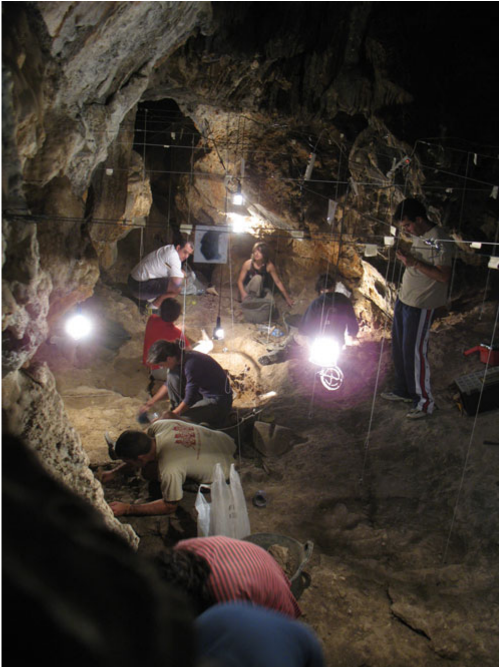
Cova de Can Figueres, Begues. Campanya d'excavació agost de 2007