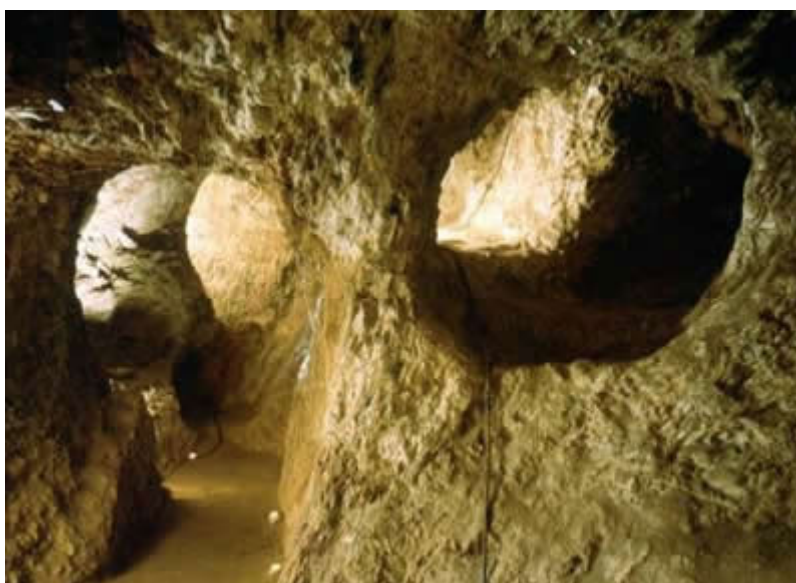
Interior de les mines neolítiques de Can Tintorer