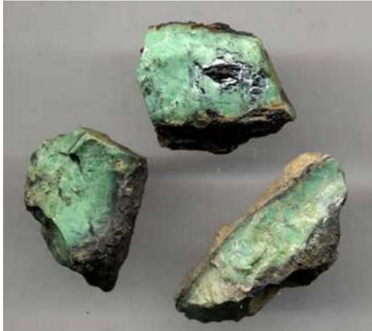
Mineral de variscita