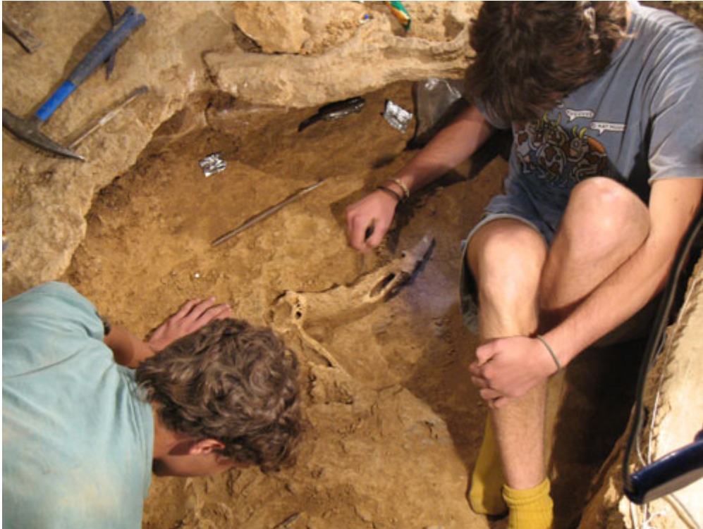
Cova de Can Figueres, Begues. Campanya d'excavació agost de 2007

En aquest ordre de coses, aquests projectes i la projecció científica dels seus resultats, han permès posar a la prehistòria recent de les nostres contrades a l'avantguarda de la prehistòria catalana. Avui es fa difícil parlar de neolític a Catalunya i regions frontereres, sense parlar de Can Tintorer o de Can Sadurní. Temes tan habituals en els congressos de prehistòria com diferenciacions i estratificacions socials, intercanvi d'objectes de prestigi a llarga distància, valors de canvi econòmic, món simbòlic, etapes evolutives del neolític a Catalunya, antiguitat de certs productes, investigacions pluridisciplinàries com l'estudi evolutiu antropològic dels éssers humans des de la prehistòria..., no serien possibles de debatre al nivell actual sense les aportacions que aquests jaciments han ofert.